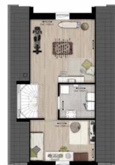
Sfeerplattegronden bouwnummer 76