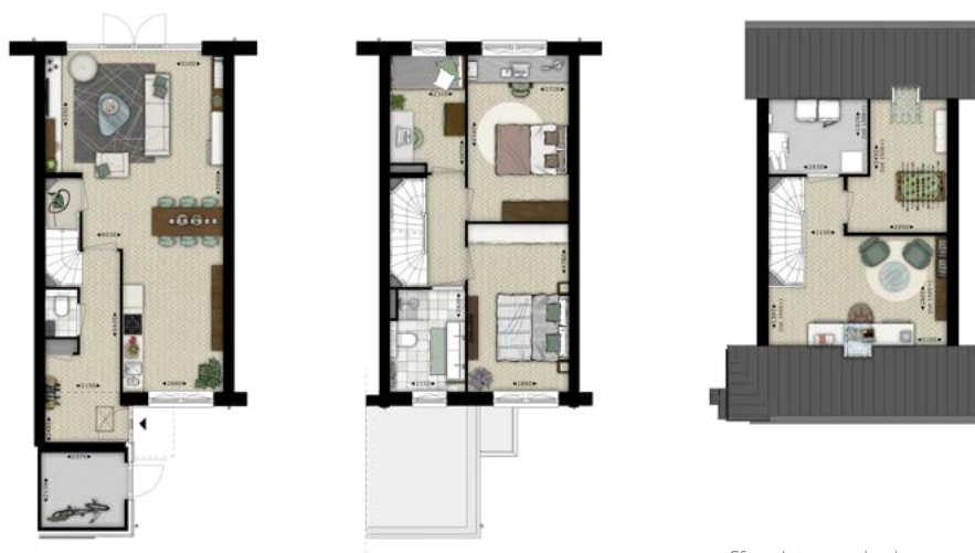
Sfeerplattegronden bouwnummer 114