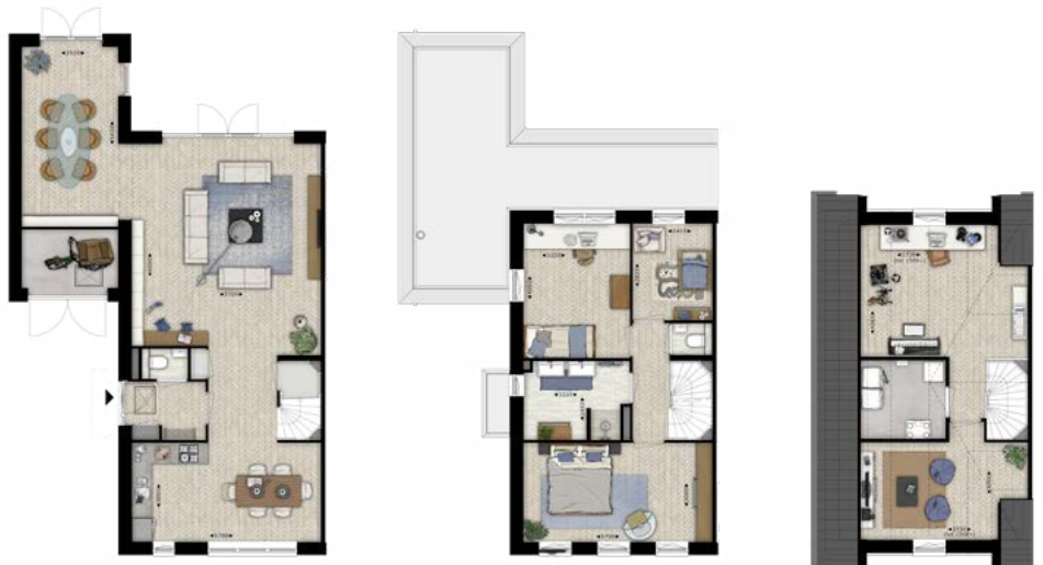
Sfeerplattegronden bouwnummer 77