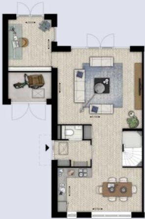
Sfeerplattegrond bouwnummer 125